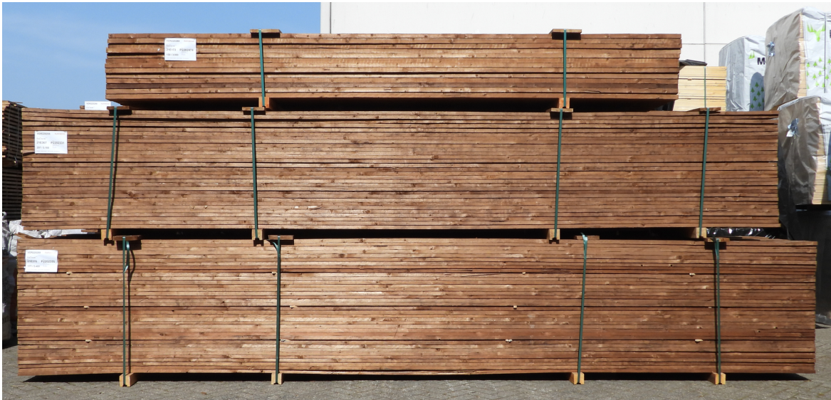
Afbeelding 1 – Onbehandeld hout op de juiste wijze opslaan